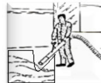
Limpeza de reservatórios e pisos com líquidos em geral